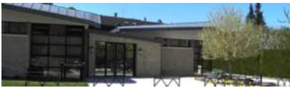
Salle des associations